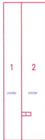
ZOLDER schaal 1:200